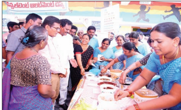
ప్రజల ఆరోగ్యానికి మరింత భద్రత కల్పించడమే